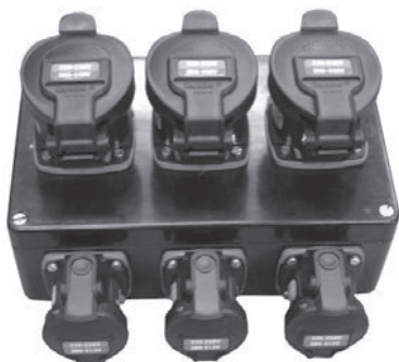
X26XS1 (260×160×90) mm