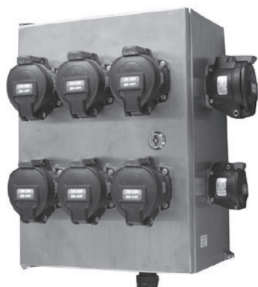
X340XS2 (300×400×190) mm